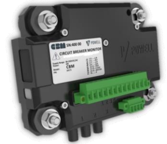
Circuit Breaker Monitor (CBM)