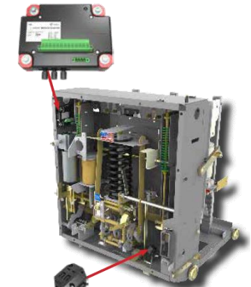
Hall Effect Sensor